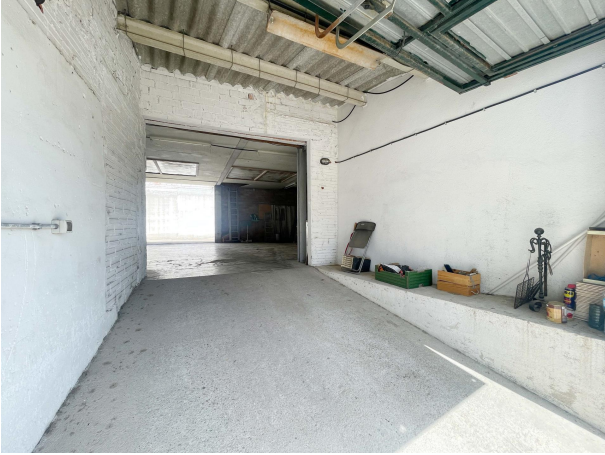
WhatsApp Image 2024-07-09 at 09.07.24 (10)