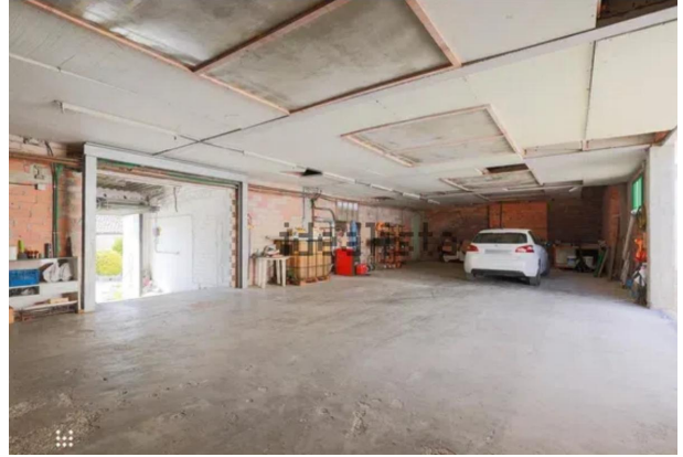
WhatsApp Image 2024-07-09 at 09.07.24 (9)