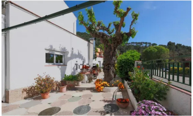
WhatsApp Image 2024-07-09 at 09.07.24 (5)