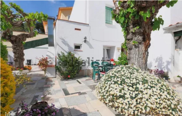
WhatsApp Image 2024-07-09 at 09.07.24 (7)