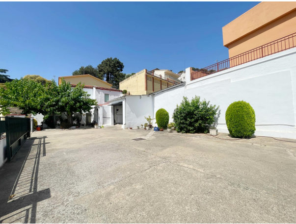
WhatsApp Image 2024-07-09 at 09.07.24 (6)