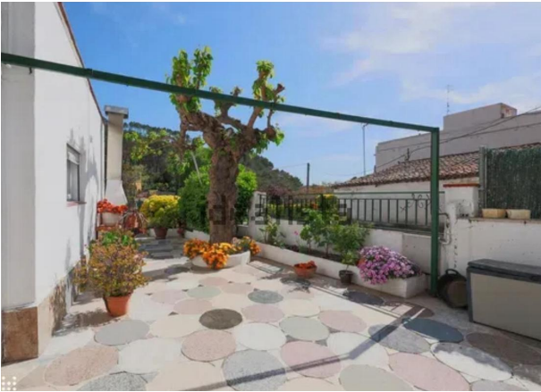
WhatsApp Image 2024-07-09 at 09.07.24 (8)