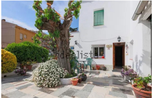
WhatsApp Image 2024-07-09 at 09.07.23