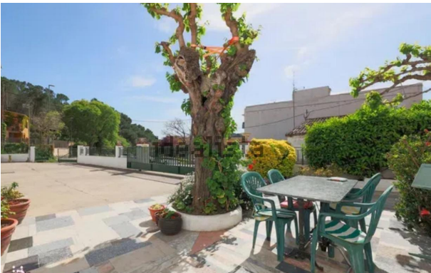
WhatsApp Image 2024-07-09 at 09.07.24 (13)