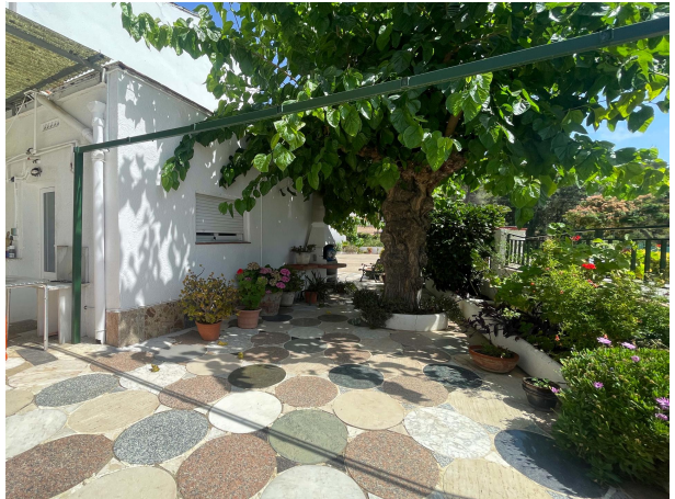
WhatsApp Image 2024-07-09 at 09.07.24 (11)