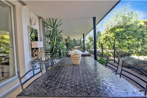
Moderne Villa mit tollem Aussenbereich