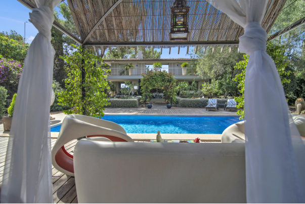
Moderne Villa schönem Aussenbereich