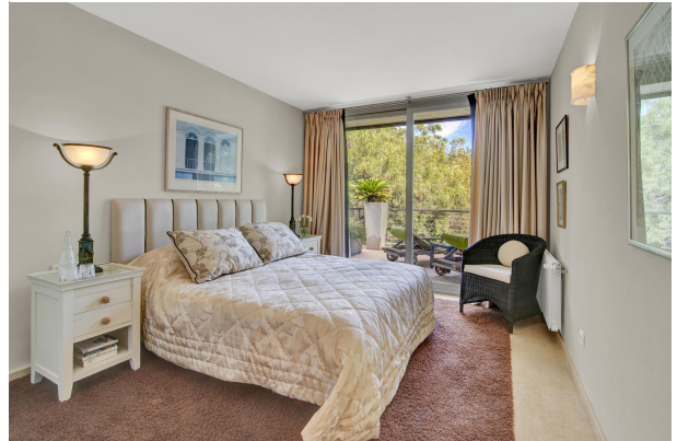
Schönes und grosses Schlafzimmer